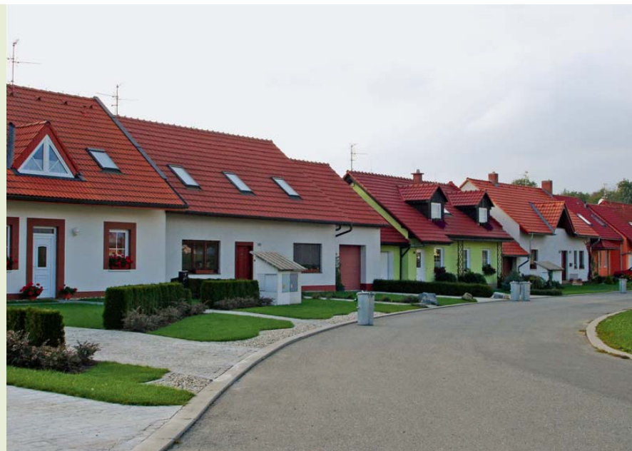
Nahoře: Příklad nové zástavby regulované nástroji územního plánování. Dole: Příklad nové stavby bez využití regulativů. Vzhled domu neodpovídá architektuře venkovského sídla.

LA-MA Land Management http://slon.fsv.cvut.cz/lama/ Portál územního plánování http://portal.uur.cz