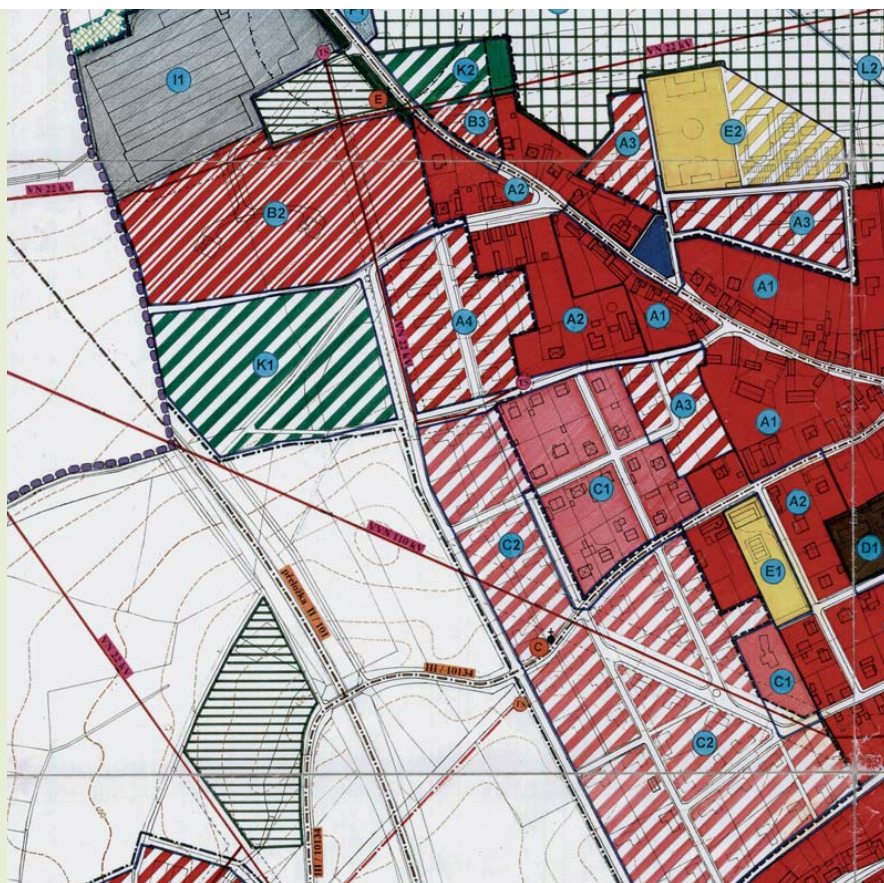
Výřez výkresu územního plánu obce Červený Újezd (okres Praha-západ) s návrhem zastavěných ploch (červeně šrafováno), které dobře navazují na stávající zástavbu (červeně).

tí vydat až do doby, než jsou nedostatky na nové stavbě odstraněny. Stavební úřad přitom může viníkovi uložit peněžitou pokutu nebo ho přinutit k zbourání nevyhovujících částí nového domu. V širším slova smyslu je stavební úřad pro obec oporou při realizaci její strategie územního rozvoje, například tím, že zamezí situaci, kdy jsou vydána kolaudační rozhodnutí pro domy dříve než pro obslužné komunikace.