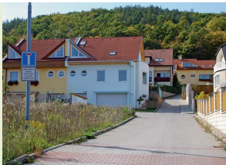
Pokud nejsou vyřešeny majetkové vztahy týkající se komunikací a technických sítí, může situace dopadnout až takto (obec Česká, okres Brno-venkov).

plánování soustřeďuje na to, které aktivity je nejvhodnější vzhledem k místním podmínkám rozvíjet, neboť strategický plán řeší otázky sociálně-ekonomického rozvoje. Jeho zpracování není závazně dáno žádnou legislativou, a proto také jeho dodržování nelze právně vymáhat. Strategický plán by měl být zpracován v koordinaci s plánem územním. Například pokud je v obci územním plánem zakázána průmyslová výroba, je nesmyslné nastavit ve strategickém plánu prioritu výstavby a provozování průmyslové zóny.