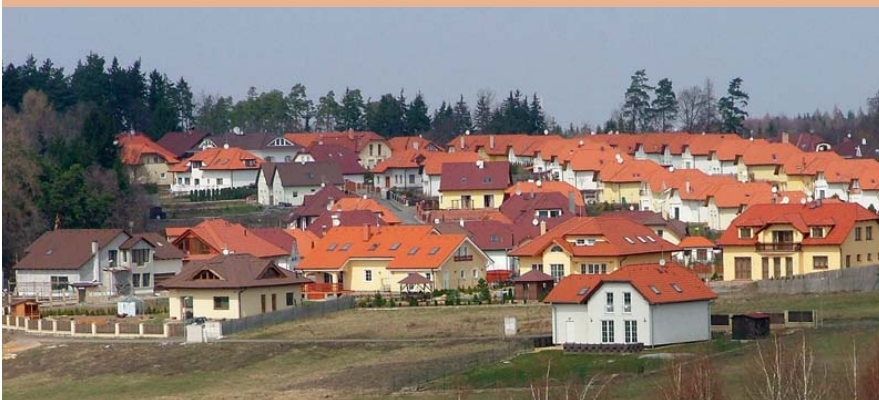
Rezidenční suburbanizace v obci Jesenice u Prahy na okraji Průhonického parku.

V zázemí českých měst můžeme v současnosti objevit jak levné domy na velmi malých pozemcích umístěné na volných plochách uvnitř obce, tak izolované „přepychové zámky“ daleko od vesnické zástavby. Za nejmé-