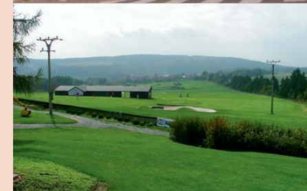
Nový suburbánní rozvoj má mnoho tváří. Na fotografiích jsou zachyceny některé z nich: řadové domky na okraji Kuřim v zázemí Brna, golfové hřiště v Dolanech u Olomouce, logistický areál v Modleticích u Prahy a obchodní centrum v pražských Štěrboholec.