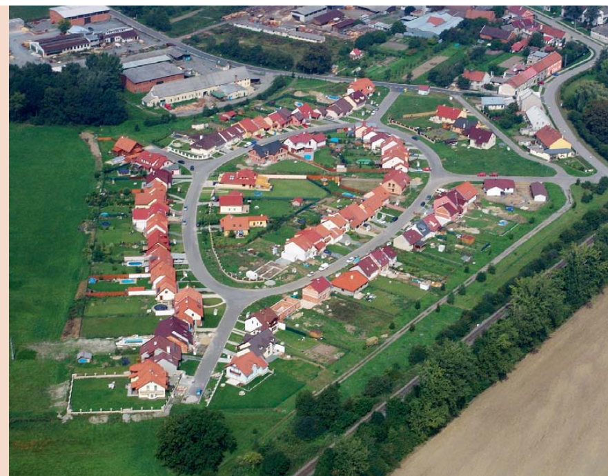
Počet obyvatel nových domů v obci Hlušovice severně od Olomouce převyšuje původní populaci.

ně udržitelnou formu prostorového růstu měst je obecně považován tzv. urban sprawl (☞ Urban sprawl ). Pouze zřídka můžeme v české krajině objevit zcela nová izolovaná sídla vzniklá suburbanizací na „zelené louce“. Tím se významně liší vývoj osídlení v České republice zejména od amerických měst, kde většina suburbánních sídel vznikla bez jakékoli návaznosti na starší osídlení.