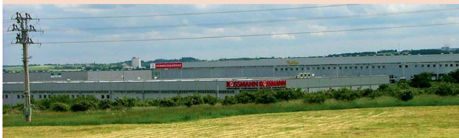
Neřízený suburbánní rozvoj lze v české krajině najít v nejrůznějších podobách. I když nepředstavuje nejvíce rozšířenou formu suburbanizace, je zdaleka největším ohrožením pro společnost i krajinu.