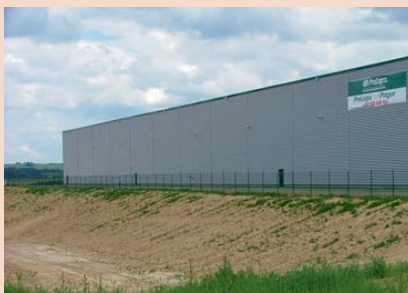
Komerční suburbanizace u dálnice D1 v Říčanech u Prahy.

Suburbanizací vznikají oblasti nové výstavby označované jako satelitní městečka (☞ Satelitní městečko ), nákupní nebo průmyslové zóny. Tyto lokality můžeme zjednodušeně rozčlenit podle převládající funkce na