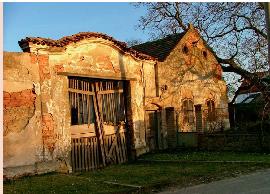
Nahore: Malá sídla byla systematicky likvidována v průběhu celého socialismu. Zastavení investic se promítlo do fyzického prostředí i do struktury obyvatelstva vesnic. Dole: Výstavba v druhé polovině dvacátého století znamenala vážný zásah do tváře vesnic.

PULDOVÁ, P., OUŘEDNÍČEK, M.: Změny sociálního prostředí v zázemí Prahy jako důsledek procesu suburbanizace.