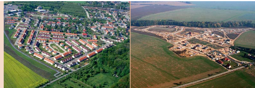
Odlíšná forma výstavby v Prazesatolicích (vlevo) a v obci Zlatá (vpravo). Zatímco v Satalicích jsou dostupné veškeré služby a nová zástavba vhodně doplňuje původní sídlo, noví obyvatelé Zlatého bydlení nebudou mít k dispozici téměř žádnou sociální infrastrukturu ani služby.

obyvatelstva přicházejícího do zázemí města. Zlepšování obytného standardu a kvality života na sídlištích může tento odliv částečně zmírnit a udržet ve městě sociálně silnější a mladší obyvatelstvo.