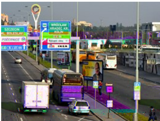
Model je všude stejný: obchodní centrum musí stát tam, kam se dá snadno dojet autem. Platí to i o Černém Mostě.