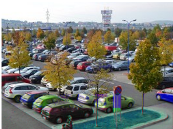
V obchodním centru Letňany je víc než 3 000 parkovacích míst.

Parkoviště u nákupních komplexů ve všední dny mnohdy slouží i jako "mezipřístávací" stanice pro lidi, kteří míří do centra Prahy a nemají kde zaparkovat.