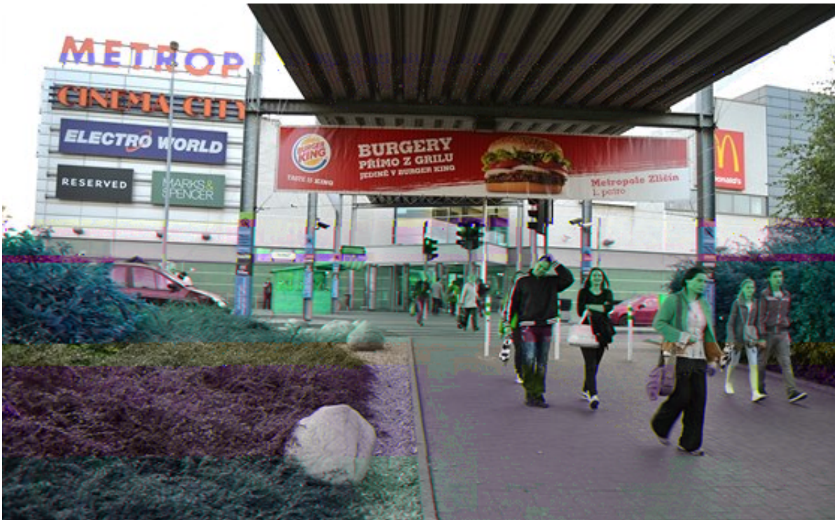
Metropole Zlín. V nákupních centrech tráví některé rodiny celý víkend.

"Miluju slevová období, to jsem schopná strávit v nákupním centru poměrně dost času," napsala jedna z oslovených žen.